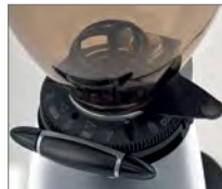
Regolazione micrometrica Stepless adjustment system