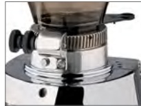
Regolazione micrometrica Micrometric adjustment