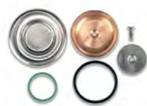
02367034 Kit Cialda Kit for Pods