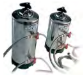
DVA12 DVA8 Depuratore Purifier DVA12, 12-liters / DVA8, 8-liters