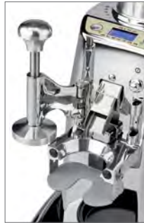
Pressa caffè brevettato Patented coffee tamper