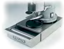
BF Cassetto "battifondi" per macinadosatore, acciaio inox. Knock-out box & base for espresso grinder, stainless steel.