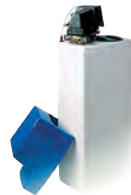
DAS26 Depuratore cabinato 26 litri a timer automatico. Boxed automatic 26-liters purifier with automatic timer.