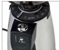
Tre dosi programmabili Three doses programmable