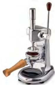
CSP Pressino Dinamometrico. Dinamometric Tamper.