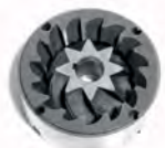
Macine Coniche Conical Mills