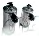
DA12 DA8 Depuratore automatico Automatic purifier DA12, 12-liters / DA8, 8-liters.