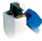
DAS12 Depuratore cabinato 12 litri a timer automatico. Boxed automatic 12-liters purifier with automatic timer.